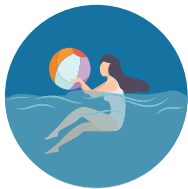
Air or Water