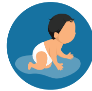
Mother to Baby During Pregnancy, Birth, or Breastfeeding