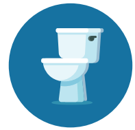
Sharing Toilets, Food, or Drinks