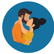
Saliva, Sweat, Tears, or Closed-Mouth Kissing