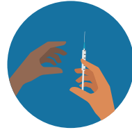
Sharing Needles to Inject Drugs