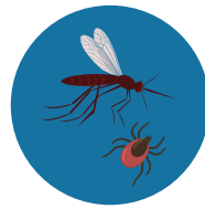
Insects or Pets